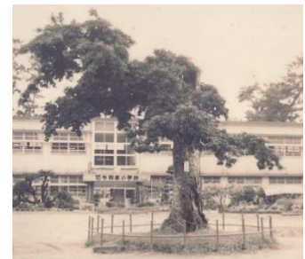
写真：初代みつの木

いたづらをして、みつの木にしぼりつけられたことがありました。みつの木をまわってこいといわれて、よく走らされました。みつの木にはふくろうが巣をつくって住みついていましたが、夜などよく鳴いていました。ほんとうにあの木だけは切ってほしくないですね。出典：座談会「今和泉の教育を語る」昭和 48 年 2 月 1 日